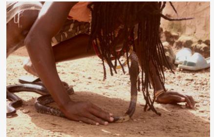
Un jeu de regards dangereux