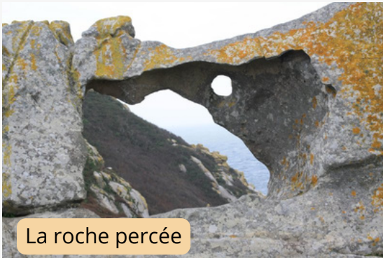
La roche percée