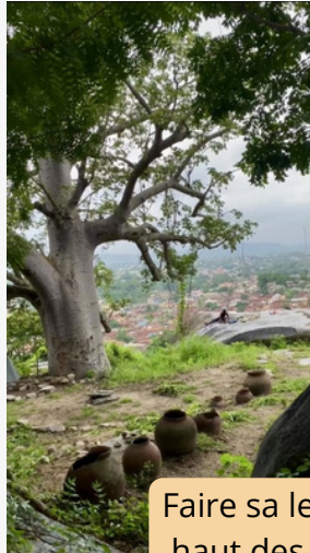
Faire sa lessive en haut des collines