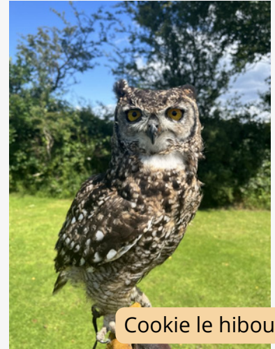
Cookie le hibou