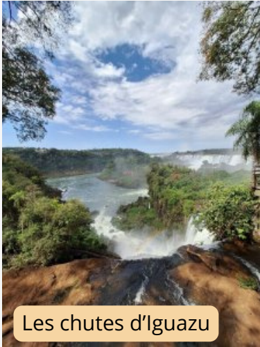
Les chutes d'Iguazu