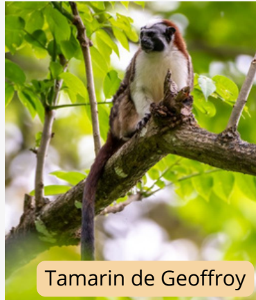
Tamarin de Geoffroy